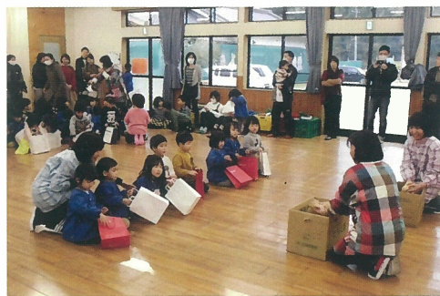
昔の遊びって楽しいね♪