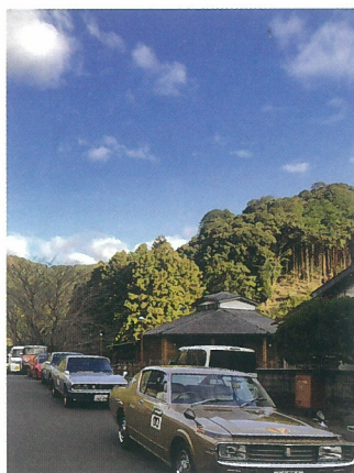
青空の下はいすゞ117クーペ