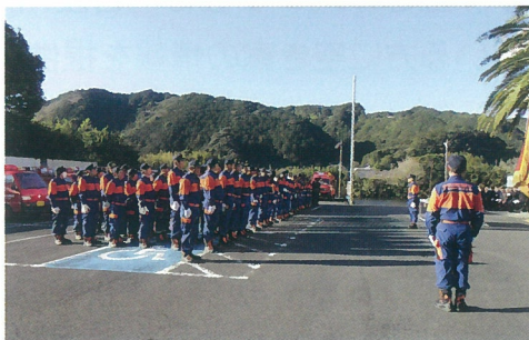
指揮者任命の様子