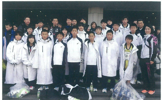
古座川町駅伝チームのみんな