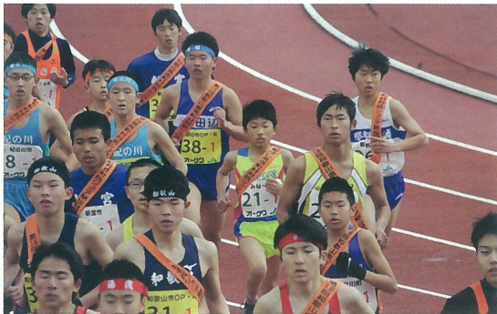
大激走の本番当日