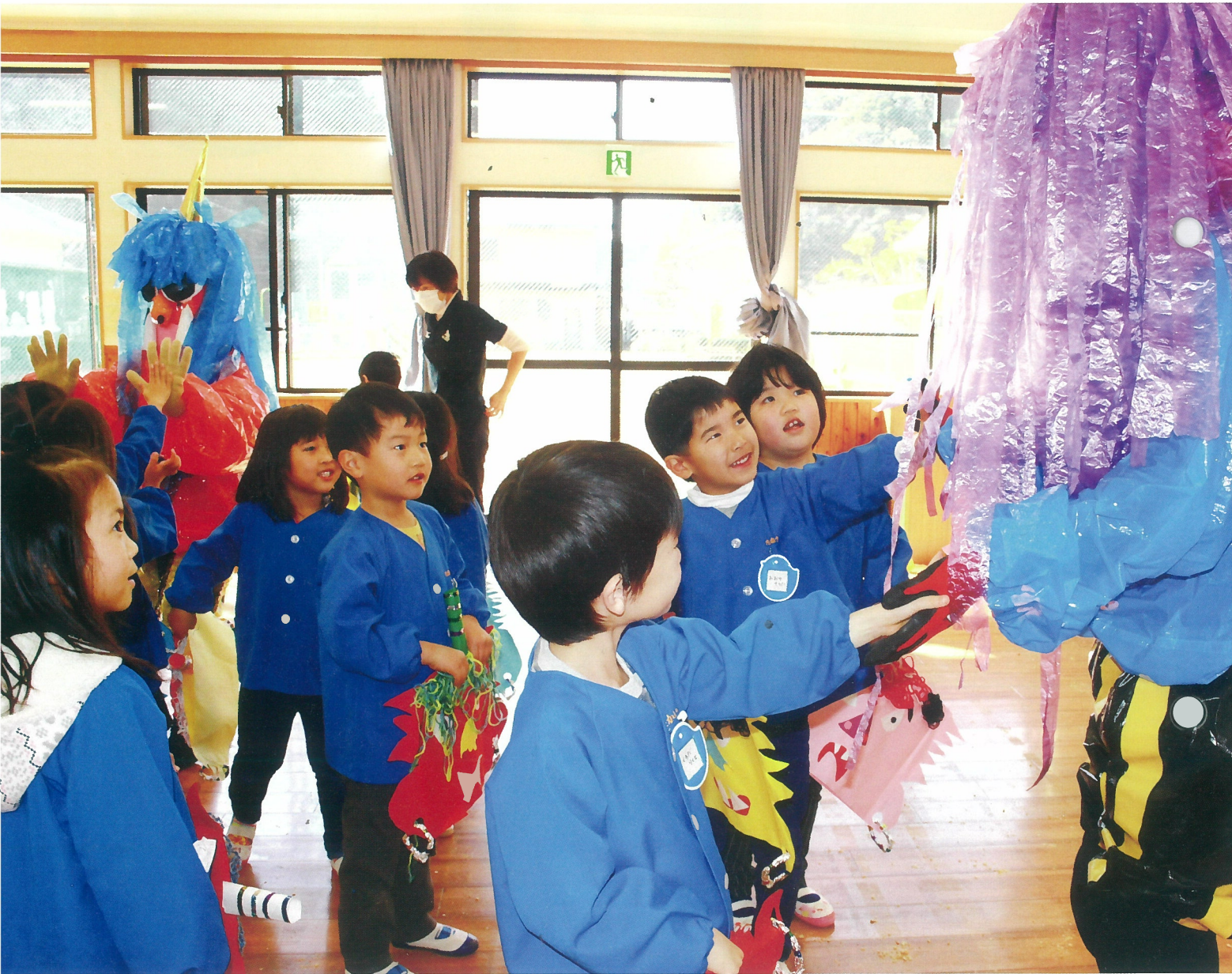
内にも鬼にも福よ来い！（高池保育所）