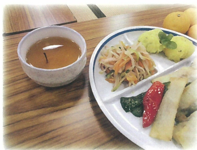
▲茶柱も立ち幸せな一時に…♪

今回は、宇津木・月野瀬地区の取り組みを紹介します。 11月に開催された食事会。この日は10名を超える参加者が集まりました。